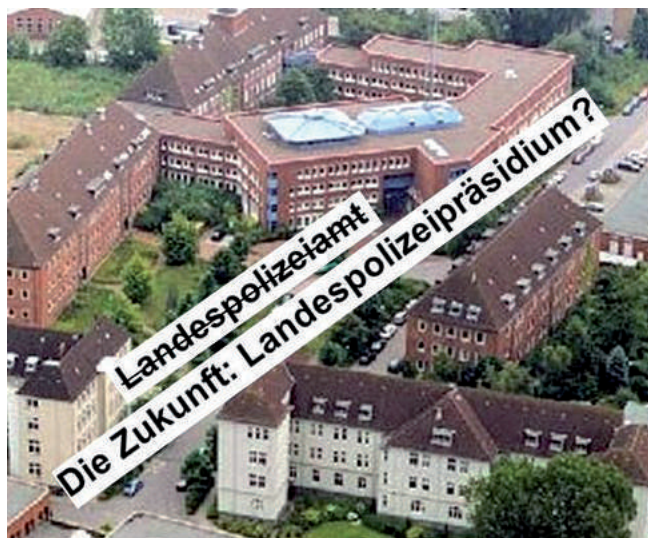
Das Landespolizeiamt könnte bald zum Landespolizeipräsidium werden.

führt sowie 15 in den Führungsstab des neuen Landespolizeipräsidiums eingegliedert werden. Der Rest des Personals würde im Ministerium bleiben, für die politische Koordination und die Kontrolle. „So haben wir praktisch neues Personal geschaffen, das die Belastung für alle Beam-