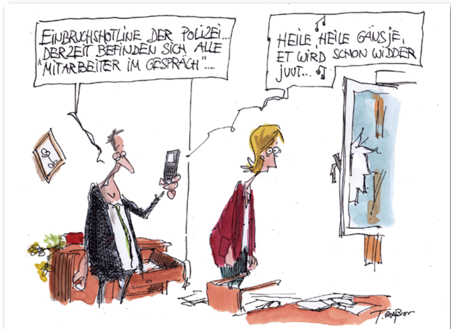
Die Verunsicherung in der Bevölkerung wächst, wie es die Frankfurter Rundschau am 27. Mai 2016 gut zum Ausdruck bringt.