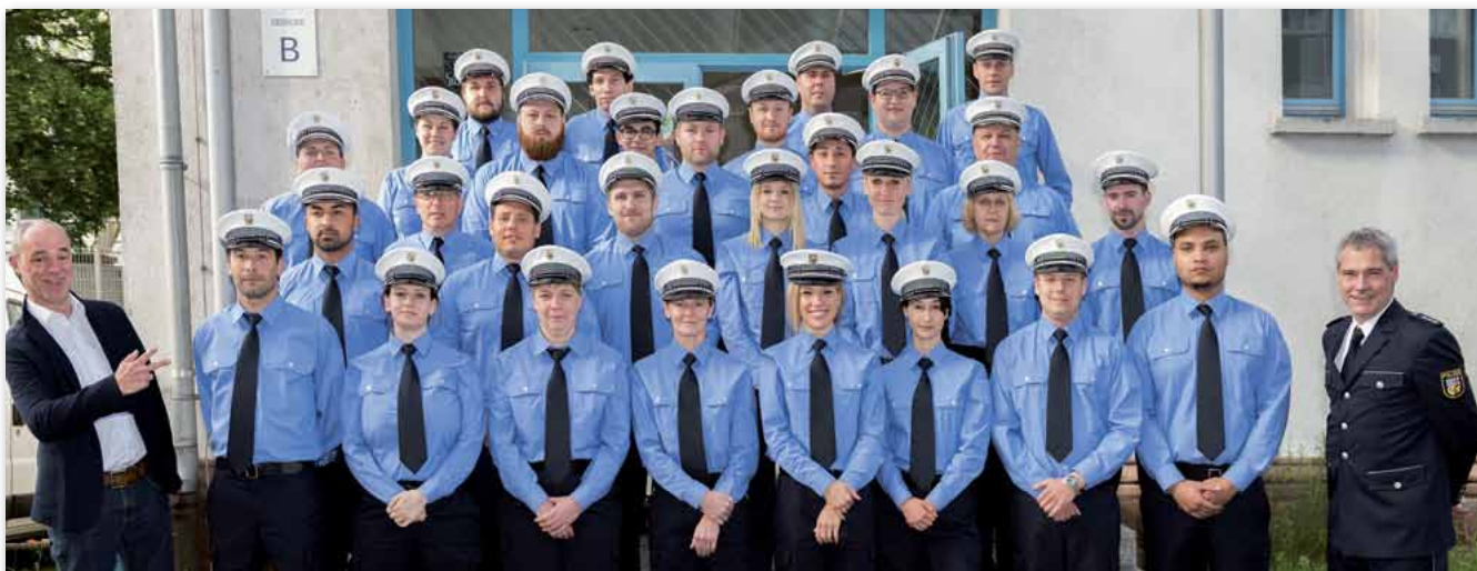
Frisch eingekleidet: Blaue Dienstkleidung, Handfesseln und Pfefferspray erhielten die neun Frauen und 21 Männer des POD unmittelbar nach ihrer Ausbildung Ende Mai.