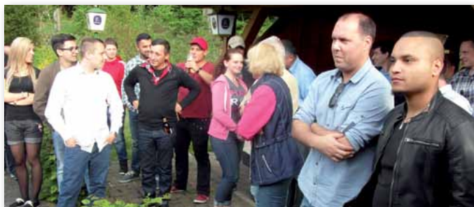
Feste arbeiten – Feste feiern: Alle Prüflinge schafften die Abschlussprüfung. POD und Ausbilder feiern im IPA-Heim Neunkirchen typisch saarländisch mit Schwenker und kühlen Blonden.

Carsten Baum, Vorsitzender der Kreisgruppe LPP