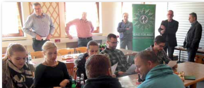
Gut informiert: Der Landesvorsitzende stellte am 17. März mit seinen Stellvertretern und den Vertretern der Kreisgruppe LPP das GdP-Leistungsangebot vor.

Es wird eine „Dienstweisung POD geben“, die alle dienstlichen Einzelheiten regelt.