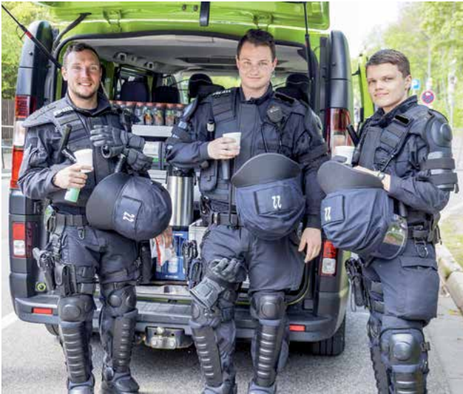
Impressionen aus dem Einsatz