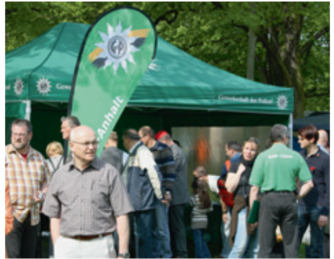
Der Stand der GdP war den ganzen Tag über Besuchermagnet.