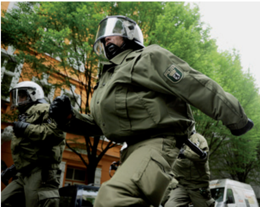
Beamte im Einsatz in Berlin – hier rund um den Aufmarsch der Rechtsextremen am S-Bahnhof Bornholmer Strasse.