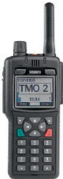
Das Handfunkgerät von Selectric Nachrichtensysteme GmbH.