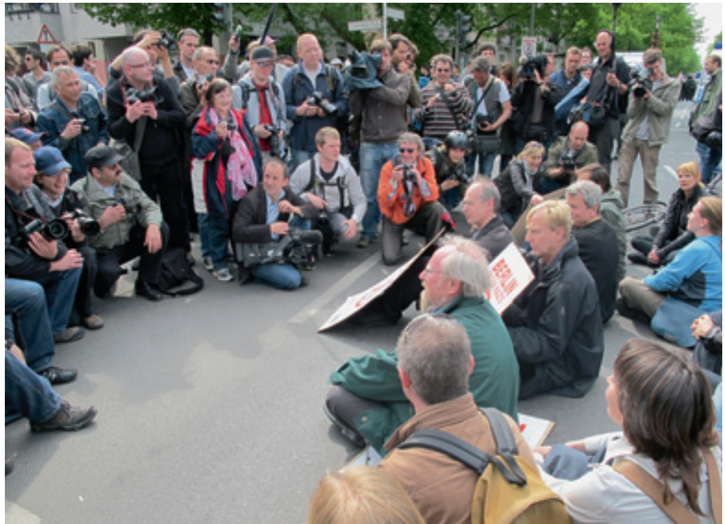
Bundestagsvizepräsidenten Thierse's medienwirksame Sitzblockade gegen Neonazis. Nicht gesehen war er hingegen am Abend, wo er mit viel Zivilcourage die Gewalttäter davon hätte abhalten können, Polizeibeamte zu verletzen.

Auch in anderen Bundesländern, nahezu in allen, bereitet sich die Polizei auf Dauereinsätze vor. Das Arbeitswochenende der Polizei in Nordrhein-Westfalen zum Beispiel beginnt bereits am Freitag mit Einsätzen bei der Walpurgisnacht in Köln, Düsseldorf und Mettmann, beim May Day in Dortmund und dem Drittliga-Spiel des Wuppertaler SV gegen Jena. Am 1. Mai ist sie neben dem Schutz der Mai-Demonstrationen des DGB bei vier parallel stattfindenden Spielen der ersten Bundesliga im Einsatz. Hinzu kommen Demonstrationen der Autonomen in Wuppertal, von Pro NRW in Solingen, der