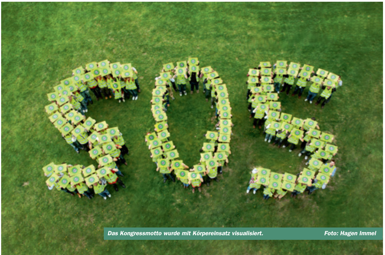
Das Kongressmotto wurde mit Körpereinsatz visualisiert.

einer womöglich „Konferenzsteifigkeit“ konnte dennoch keine Rede sein, denn bei aller Ernsthaftigkeit kam auch der Spaß nicht zu kurz. Die jungen Kolleginnen und Kollegen wurden insgesamt als professionell agierend und hoch motiviert wahrgenommen – mit jeder Menge Lebensfreude und einem hohen Anspruch an sich und die Gesellschaft. Sie haben längst erkannt: Das, wofür man sich heute stark macht,