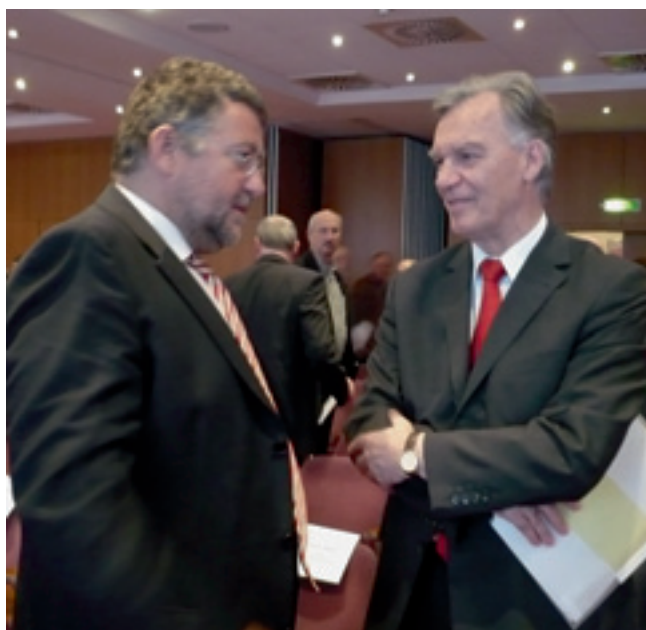
BKA-Präsident Jörg Ziercke im Gespräch mit dem diesjährigen Schirmherrn der Tagung, Brandenburgs Innenminister Rainer Speer. Der Schirmherr würdigte in seinem Grußwort explizit die honoräre Arbeit der BAG.

Ideal wäre es, wenn ein Betroffener selbst den ersten Schritt, weil ihm nahestehende Menschen oder sein Hausarzt, Vorgesetzte oder Kollegen auf Zeichen eine möglichen Sucht angesprochen haben und er daraufhin erkennt, dass er tatsächlich