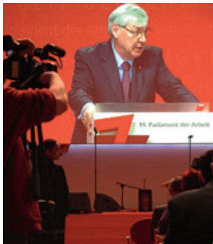
Der wiedergewählte DGB-Bundesvorsitzende Michael Sommer: „Unsere Gesellschaft muss in eine gute, in eine soziale, in eine solidarische Ordnung gebracht werden.“

Vor dem Hintergrund der Wirtschafts- und Finanzkrise wies Michael Sommer darauf hin, dass die Krise eine gewaltige Schneise in die ohnehin schon knappen Staatshaushalte geschlagen habe. Als Beispiele dafür nannte er die Kürzungen im öffentlichen Dienst oder die Kappung der Renten und sozialen Leistungen. „Ich kann nur jeden in diesem Land davor warnen, die-