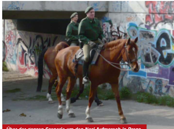
Über der ganzen Szenerie um den Nazi-Aufmarsch in Prenzlauer Berg kreiste am 1. Mai unaufhörlich der Polizeihubschrauber. Für die Pfade in den umliegenden Kleingärten machten sich hingegen die Polizeipferde gut.

Ahlhaus hat mit dem diesjährigen 1. Mai ein ähnliches Fiasko erlebt, wie sein Berliner Amtskollege Körting ein Jahr zuvor, als dieser nämlich von der mas-