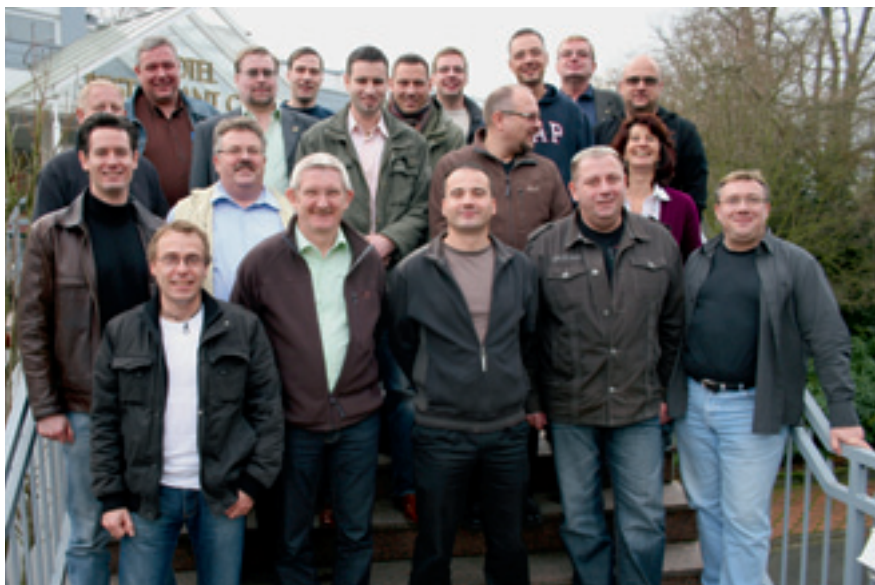
Teilnehmer des Vertrauensleute-Seminars

wandt oder werden in der nächsten Zeit erstmals Seminare für Vertrauensleute durchführen. Annette Terweide