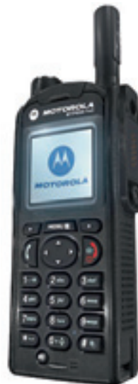
Das Handfunkgerät von Motorola GmbH.