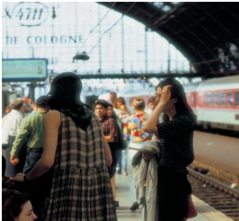
Zwei Millionen Menschen beschäftigt die Schattenwirtschaft in Deutschland. Viele kommen aus osteuropäischen Ländern.

Die nun schon seit vielen Jahren praktizierte Duldung und Förderung massenhafter illegaler Beschäftigungsverhältnisse am Bau hat dazu geführt, daß dieses „erfolgreiche“ Modell auch in anderen Bereichen übernommen wurde. Zum einen können sich aufgrund von Inseraten in der örtlichen Zeitung auch private Häuslebauer ihre polnische Bauarbeiterkolonne für den Bau oder die Renovierung ihres Hauses bestellen. Zum anderen berichten die Ermittler von Großgärtnereien, Großbäckereien, Groß-