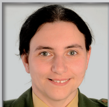
VII. BPA Außenstelle Nabburg