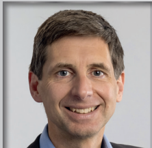
VI. BPA Dachau