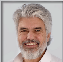
VII. BPA Sulzbach-Rosenberg