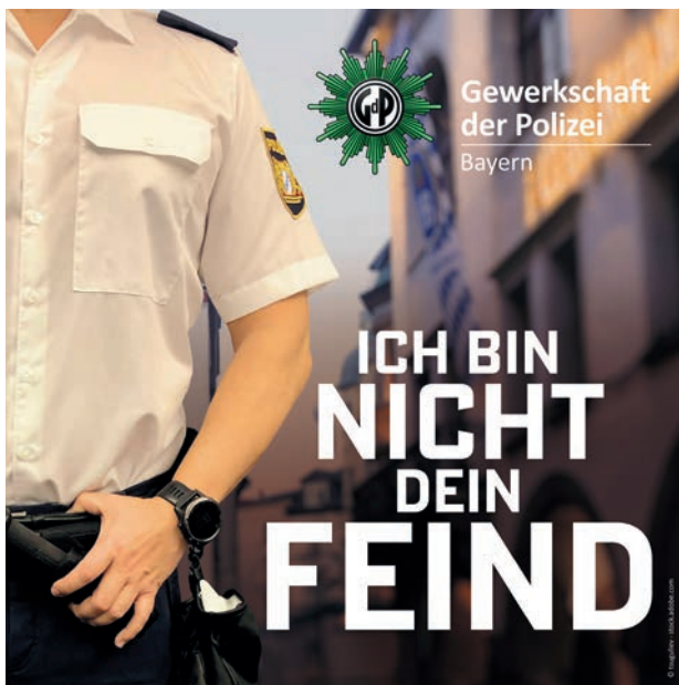
Grafik: Christiane Freitag