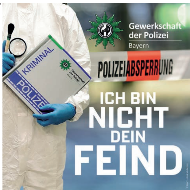
Grafiken: Christiane Freitag

oder gar die Naivität Einzelner im Spiel sind, nichts rechtfertigt einen Angriff auf die Polizei!