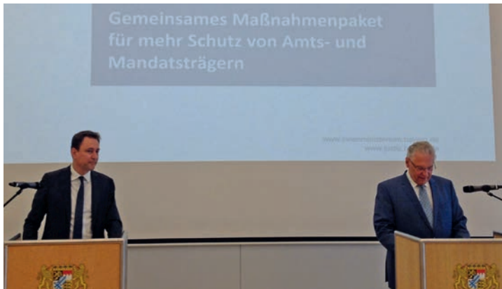
V. l.: Justizminister Georg Eisenreich und Innenminister Joachim Herrmann präsentieren ihr Maßnahmenpaket zum besseren Schutz für Kommunalpolitiker vor Hass, Hetze und Bedrohungen.