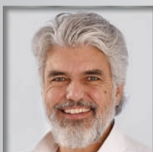
VII. BPA Sulzbach-Rosenberg