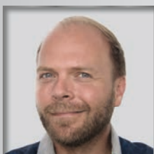
V. BPA Königsbrunn