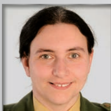
VII. BPA Außenstelle Nabburg