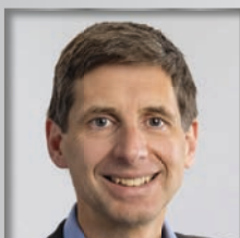
VI. BPA Dachau