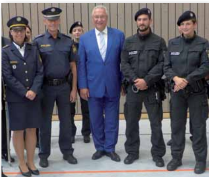
Innenminister Joachim Herrmann präsentiert auf einer Pressekonferenz in der I. BPA München noch mal alle Uniformmodelle aus allen Polizeiparten in Grün und Blau und erklärte die Umstellung auf Blau für abgeschlossen.

Wie geht's nun weiter? Die GdP wird alle Mails detailliert auswerten und dann sowohl mit LZN als auch dem Team Dienstkleidung sprechen, um Optimierungen zu erreichen – auch wenn es nur ein Prozent der Dienstkleidungsträger sind, die sich gemeldet haben. So mancher hat nämlich einfach resigniert. Aus vielen der eingegangenen Zuschriften ist eine gewisse Enttäuschung herauszulesen. Auch Teilnehmer des Trageversuchs meldeten sich und berichten, dass die Materialien des Trageversuchs ihrer Ansicht nach besser waren. Dazu ist aber auch zu sagen, dass im Rahmen des Trageversuchs Verbesserungsvorschläge eingegangen sind, die man umgesetzt hat. Insofern kann man die neue Uniform nicht unbedingt mit den Teilen aus dem Trageversuch direkt vergleichen. Aber manchmal ist ja etwas gut gemeint, zeigt dann aber in der Praxis, dass es nicht so sinnvoll war, wie man sich das gewünscht hatte. Deshalb gilt auch bei der neuen Uniform: Wir müssen daran arbeiten, dass weiter optimiert wird. PSch