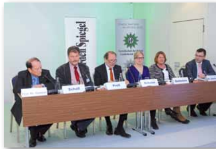
Teilnehmer der Podiumsdiskussion