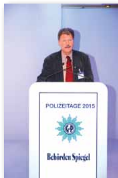
LV Peter Schall

Landesvorsitzender Peter Schall zeigte in seinem Referat die Vielfalt von Präventionsmaßnahmen auf, wies allerdings auf die Arbeitsbelastung der Polizeibeamten/-innen hin, aufgrund derer Präventionsmaßnahmen und Aufklärungsveranstaltungen durch die Polizei leider oft nicht mehr geleistet werden können. Obwohl primäre Aufgabe nach Art. 2 Abs. 1 des PAG, werde diese Aufgabe oft vernachlässigt. So sei Vorbeugung in der Kriminalstatistik auf den ersten Blick nicht erkennbar. Die Statistik wird oft nur als Arbeitsnachweis interpretiert, dies führe aber mitunter in die Irre. Beim Controlling werde mit-