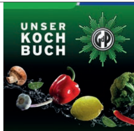
Grafik: Christiane Freitag

Für die Personalratswahlen am 22. Juni 2021 hatte die GdP für alle Wählerinnen und Wähler ein eigenes Kochbuch mit Rezepten ihrer Kandidatinnen und Kandidaten veröffentlicht. Die GdP konnte bei den Wahlen in einigen Teilen der Präsidialbereiche deutliche GdP-Mehrheiten verteidigen und auch in den übrigen Präsidien erfreuliche Ergebnisse erzielen.