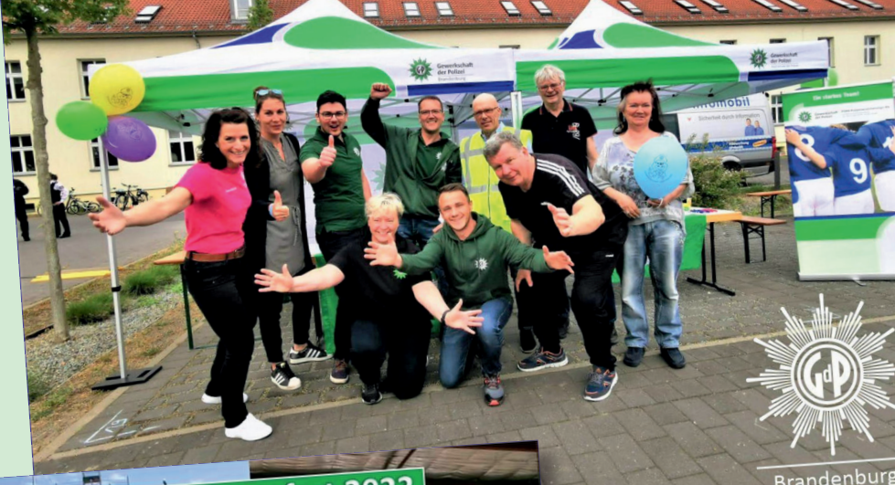
Vertrauensleutekonferenz der GdP Brandenburg