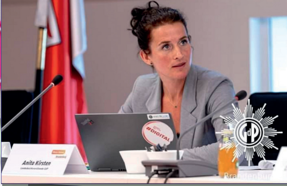
GdP beim Tag der offenen Tür im Polizeipräsidium

Cyberkriminalität Wie gut ist die Brandenburger Polizei aufgestellt?