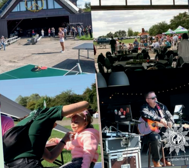
GdP Sommerfest 2022

Seite an Seite gemeinsam stark für uns, für die Polizei!