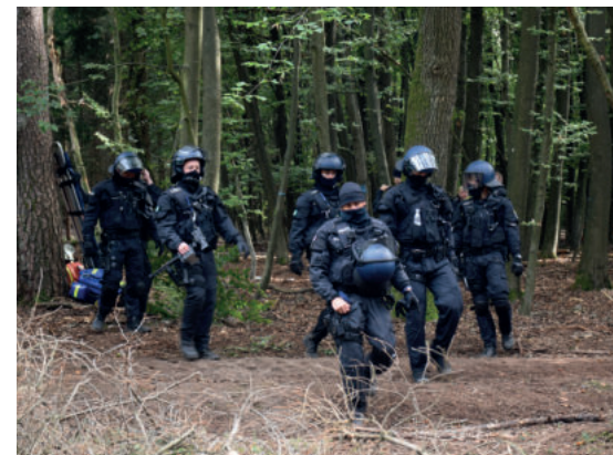
Abtransport eines Störers

zende Bäume, die nach der Durchtrennung eines Seiles in Richtung von Kollegen stürzten. Oder Tritte gegen den Kopf von Einsatzkräften in ca. 8 Meter Höhe. Oder etwa ein