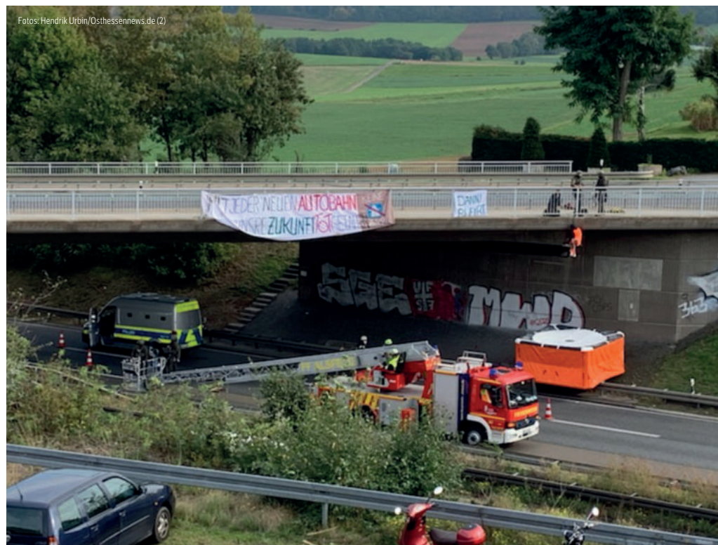
Das Herabhängen von Autobahnbrücken bringt Verkehrsteilnehmer in Lebensgefahr.

Problematisch ist auch der Umgang mit Personen, die nach ihrer Festnahme wieder entlassen werden, ohne dass ihre Persona-