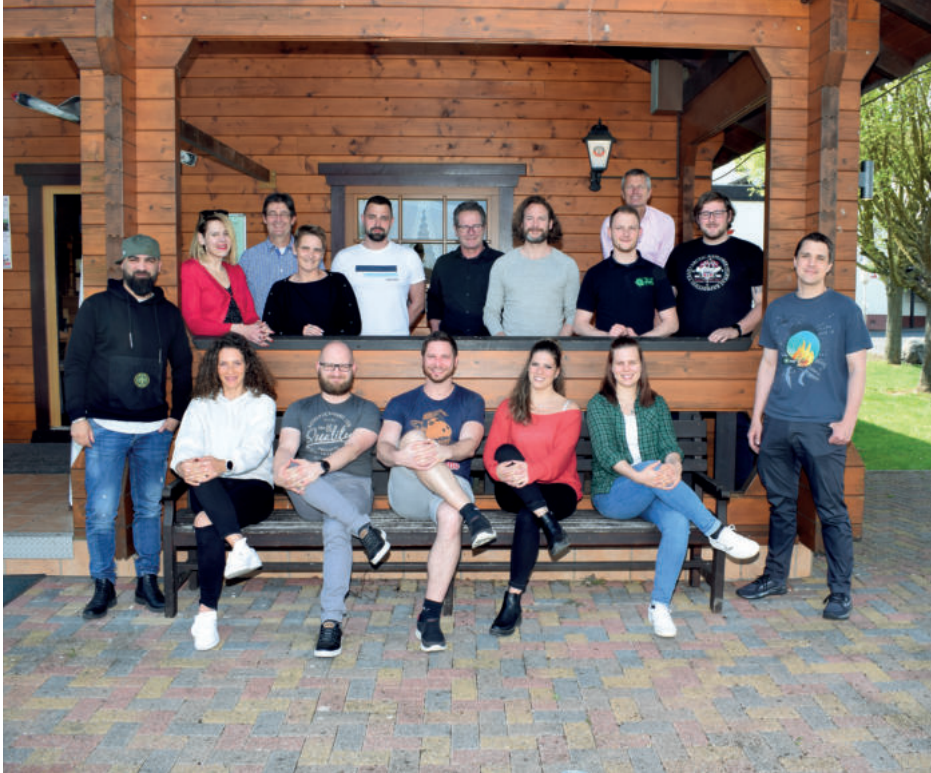
Die Teilnehmerinnen und Teilnehmer des Seminars