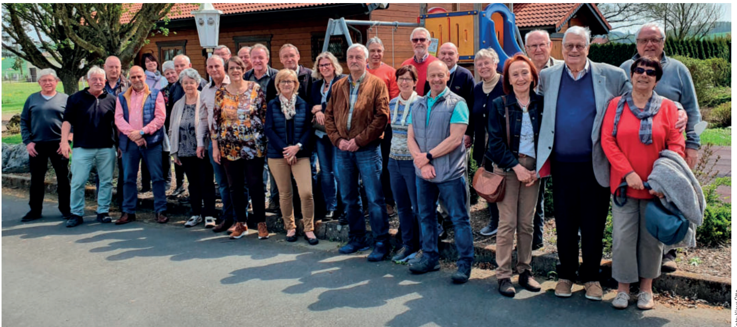
Die sichtlich zufriedenen Teilnehmerinnen und Teilnehmer des Seniorenseminars