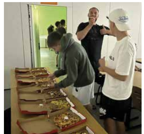
Eine kleine Stärkung gab es auch noch.