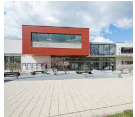
Das Hörsaal/Mensa-Gebäude der FH