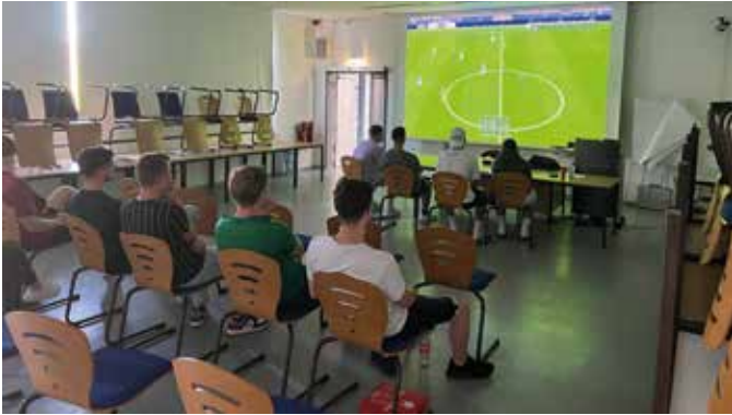
Volle Konzentration beim Zocken

Am 7. September 2023 lud die JUNGE AGRUPPE der Gewerkschaft der Polizei Sachsen-Anhalt zu einem Event der ganz besonderen Art und Weise ein. In den beiden Mehrzweckräumen der Fachhochschule der Polizei in Aschersleben durften sich Auszubildende und Studierende auf riesigen Leinwänden entweder bei einem FIFA 23 Fußballturnier auf der Xbox One oder bei einem Mario Kart Turnier auf der Nintendo Switch batteln.