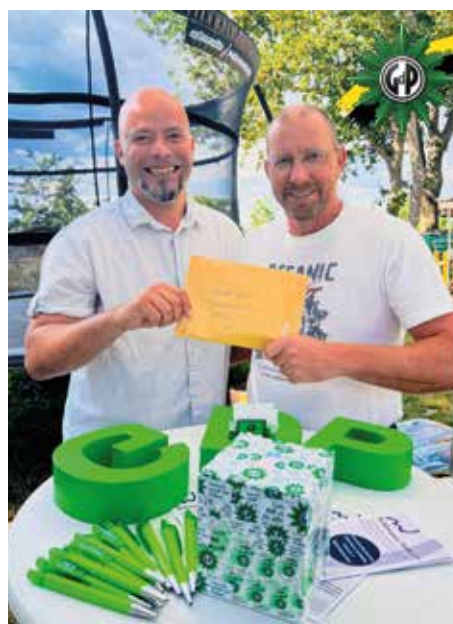
Die Übergabe des Spendenschecks