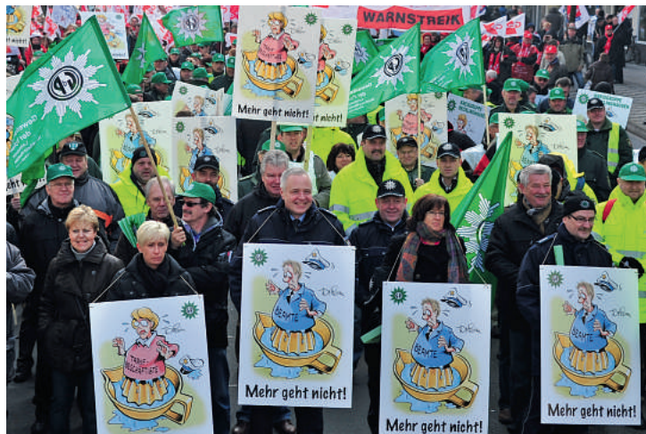
Bei der Polizei gibt es keine Reserven mehr. Darauf hat die GdP immer wieder hingewiesen, wie hier in der Tarifrunde 2010.

WAZ erklärt. Die GdP fordert deshalb eine Aufstockung der Neueinstellungen auf 1700. Damit könnten im Wach- und Wechseldienst und in den Ermittlungsdiensten zumindest die Lücken gefüllt werden, die durch die familienbedingten Ausfallzeiten entstehen (siehe DP 3/2012). Und es würden Ressourcen frei, um in den kommenden Jahren schrittweise drei weitere Hundertschaften in NRW aufzustellen und so den dort herrschenden unzumutbaren Belastungen entgegenzuwirken. Weitere Kernforderung der GdP ist die Stärkung der sozialen Sicherheit für alle Beschäftigten bei der Polizei – egal, ob im Beamten- oder im Tarifbereich.