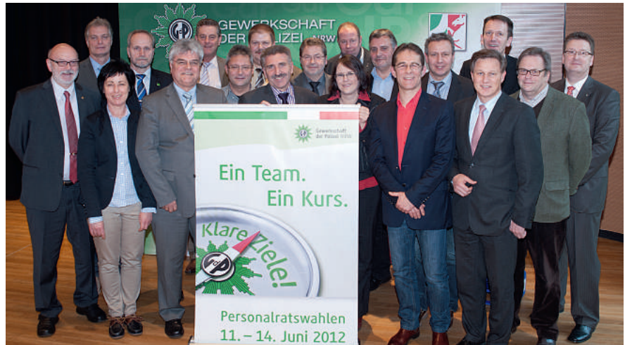
Die Spitzenkandidatinnen und -kandidaten der GdP für den PHPR