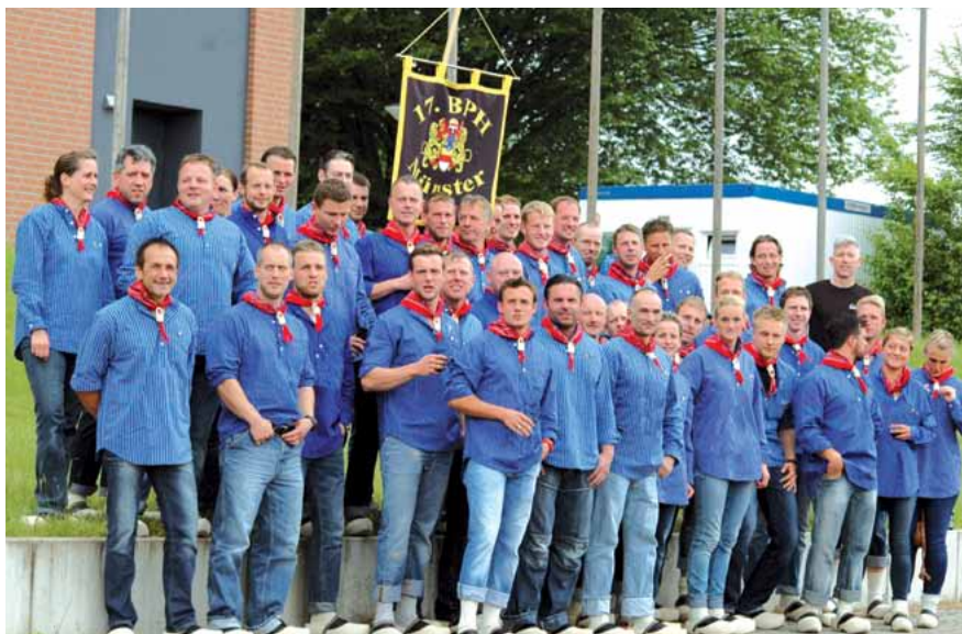
Am 4. Juni ist die 17. BPH Münster bei dem „Tag der Bundesbereitschaftspolizei“ in Duderstadt für das Land Nordrhein Westfalen gestartet. Mehr als 1600 Einsatzkräfte der Bundespolizei und aus den Ländern, aber auch drei ausländische Polizeieinheiten nahmen an dem wohl größten Vergleichswettkampf teil. In zehn taktischen Disziplinen mussten insgesamt 21 Teams komplexe Einsätze bewältigen. Hierzu gehörten unter anderem die Trennung gewaltbereiter Fußballfans, Maßnahmen bei Versammlungen und die Bewältigung von Amoklagen. In acht von zehn Disziplinen belegte die Einsatzhundertschaft aus Münster einen der ersten drei Plätze und sicherte sich so den Gesamtsieg.