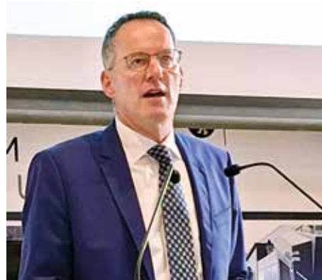
Staatsminister Ebling stellt klar, dass der Polizeiberuf ein besonders belastender Beruf ist.

Und ganz viel Bildschirmarbeit: Der PC ist aus nahezu keinem Arbeitsbereich mehr wegzudenken. Und deshalb gibt es viel zu beachten an den Arbeitsplätzen in der Polizei. Der Arbeitsschutz ist aus gutem Grund gesetzlich vorgeschrieben und die Polizei ist gut beraten, eine gut durchdachte Arbeitsschutzorganisation vorzuhalten. Beschaffungen, resultierend aus den ebenfalls gesetzlich vorgeschriebenen Gefährdungsbeurteilungen, sind oft teuer und müssen eingeplant werden.