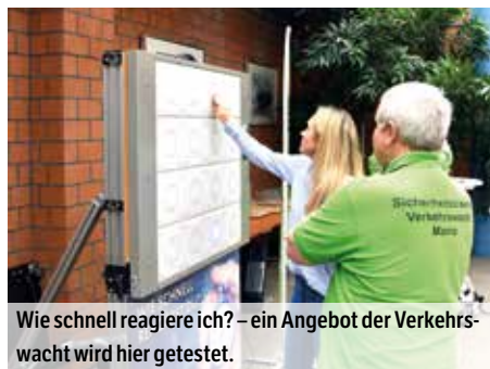
Wie schnell reagiere ich? – ein Angebot der Verkehrswacht wird hier getestet.