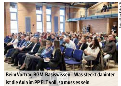
Beim Vortrag BGM-Basiswissen – Was steckt dahinter ist die Aula im PP ELT voll, so muss es sein.