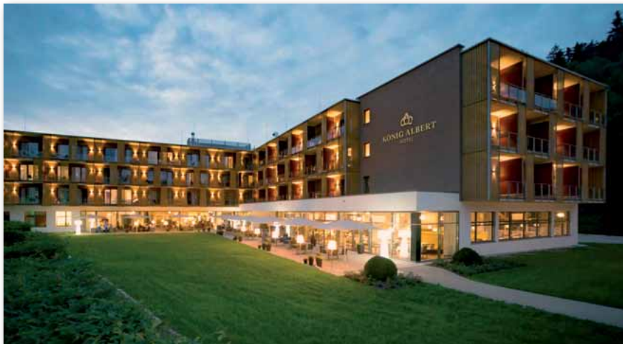
Hotel „König Albert“ in Bad Elster

Die Zimmer stehen am Anreisetag ab 15.00 Uhr und am Abreisetag bis 11.00 Uhr zur Verfügung.