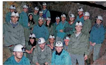
Lehrgruppe 9/15-33 der Polizeifachschule Chemnitz

Besonders interessant wurde es, als wir eine Leiter aufstiegen, die uns 50 Meter nach oben führte, und wir niedrige Durchgänge betraten, in denen wir uns sehr kleinmachen mussten. Insgesamt dauerte die Führung 2,5 Stunden. Wieder vollzählig über Tage angekommen, trieb uns der Hunger in die Gaststätte „Stadtwirtschaft“, bekannt für ihre böhmischen Gerichte, in der Freiburger Altstadt. Nachdem alle gesättigt waren, schlen-