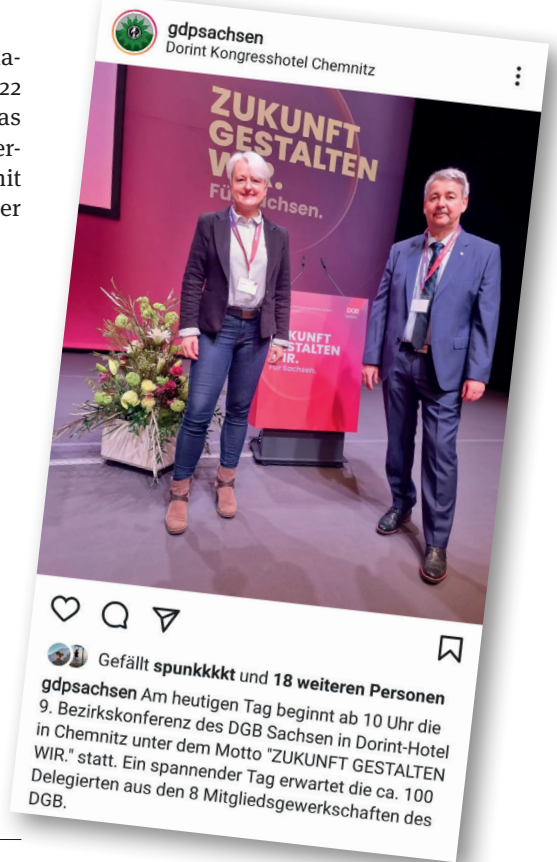
Gefällt spunkkkkt und 18 weiteren Personen gdpsachsen Am heutigen Tag beginnt ab 10 Uhr die 9. Bezirkskonferenz des DGB Sachsen in Dorint-Hotel in Chemnitz unter dem Motto "ZUKUNFT GESTALTEN WIR." statt. Ein spannender Tag erwartet die ca. 100 Delegierten aus den 8 Mitgliedsgewerkschaften des DGB.

Mit Auslaufen der Sächsischen Corona-Notfall-Verordnung am 10. Januar 2022 und sinkender Infektionszahlen soll das Aufheben von Einschränkungen des Versammlungsrechts geprüft werden. Damit sollen auch die Polizeibeamten wieder mehr Handlungsfähigkeit erlangen. ■