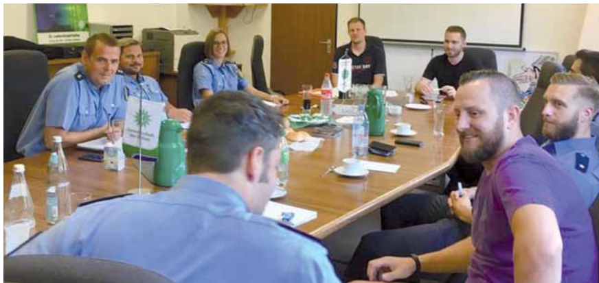
Drängende Probleme bei unseren OpE-Einheiten sind zu lösen