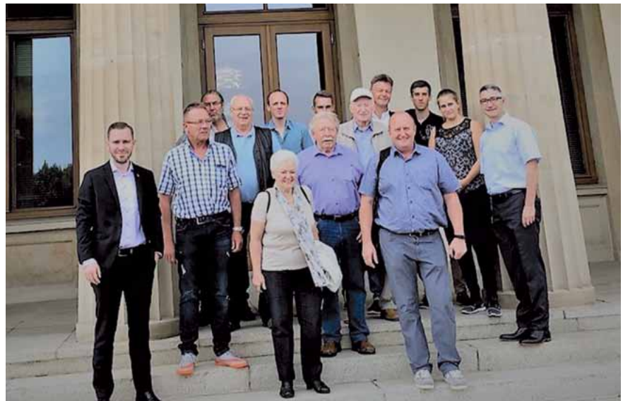
Freundlicher Empfang am Landtag

Am 11. 6. 2018 besuchte eine Abordnung der GdP-Kreisgruppe Merzig-Wadern auf Einladung der CDU-Fraktion den Saarländischen Landtag. Nach einer Besichtigung des Plenarsaales und einer Einführung in die Parlamentsarbeit folgte eine Aussprache mit der stellvertretenden Vorsitzenden der CDU-Fraktion im Saarländischen Landtag, Helma Kuhn-Theis. In einem offen und konstruktiv geführten Gespräch, an dem auch der neu gewählte Landeschef der saarländischen GdP, David Maaß, teilnahm, konnten die Mitglieder der KG Merzig-Wadern ihre Anliegen und Fragen vortragen. Diese Gelegenheit wurde auch genutzt, um noch einmal auf die Problematik der geplanten Schließungen der Polizeiposten im Landkreis Merzig-Wadern hinzuweisen. Insbesondere für die Erhaltung der Polizeiposten Losheim und Perl sagte die Abgeordnete und Vorsitzende des CDU-Kreisverbandes Merzig-Wadern ihre volle Unterstützung zu. Helma Kuhn-Theis hatte sich bereits in der Vergangenheit schon erfolgreich für den Erhalt der Polizeiinspektion in Wadern eingesetzt und folgte dem Argument, dass eine weitere Ausdünnung der Polizeipräsenz im flächengrößten Landkreis nicht im Sinne der Bürger sein kann. Auch für die mit Blick auf die