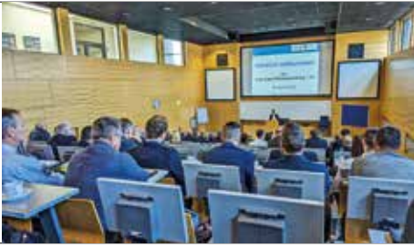
F3-Tagung in Meiningen