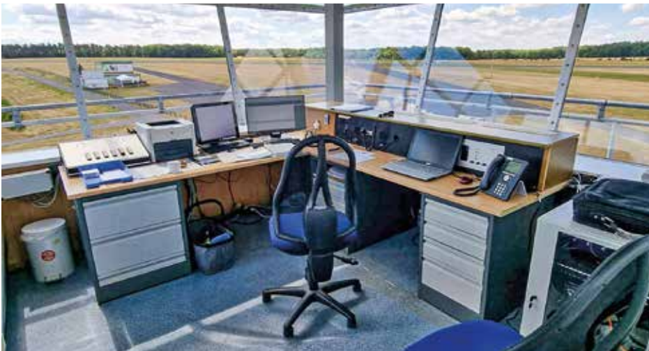
Der Flugplatz vom Tower aus gesehen