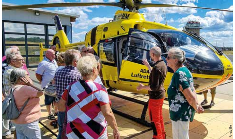
Der Pilot (2. v. r.) erläutert seine Maschine.

In den 1980er-Jahren wurde das ehemalige Kombinat Carl Zeiss Jena Miteigentümer des Flugplatzes und es erfolgte der asphaltierte Ausbau der Landebahn, welche bis zum heutigen Zeitpunkt stetig bis auf die endgültige Länge von 1170 m erweitert wurde. Nach der Wende wurde der Flugplatz Schöngleina nach und nach zum Verkehrs-