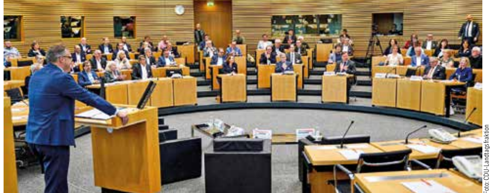
Justiz-Forum der CDU

Zur Information für die Kollegen des gehobenen Dienstes, die sich vermutlich fragen,