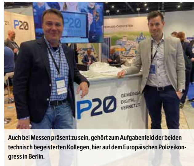
Auch bei Messen präsent zu sein, gehört zum Aufgabenfeld der beiden technisch begeisterten Kollegen, hier auf dem Europäischen Polizeikongress in Berlin.

Die meisten Mitarbeiterinnen und Mitarbeiter kommen aus dem PP ELT, insbeson-