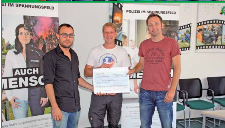
... an den Verein „Keine Gewalt gegen Polizisten“ ...