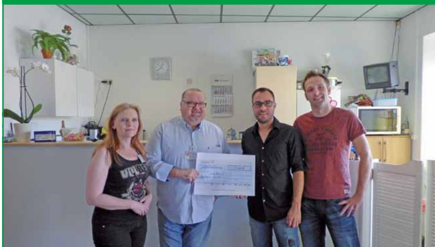
... und an den Verein „Soziale Mitte e.V.“.