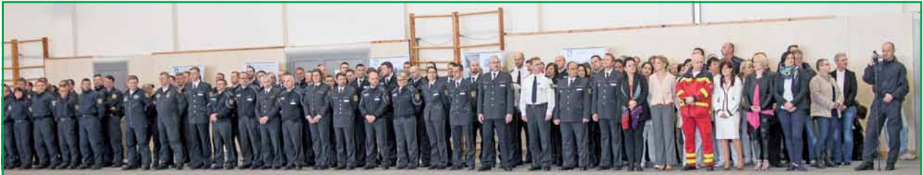
Das Jubiläum wurde im großen Rahmen begangen.