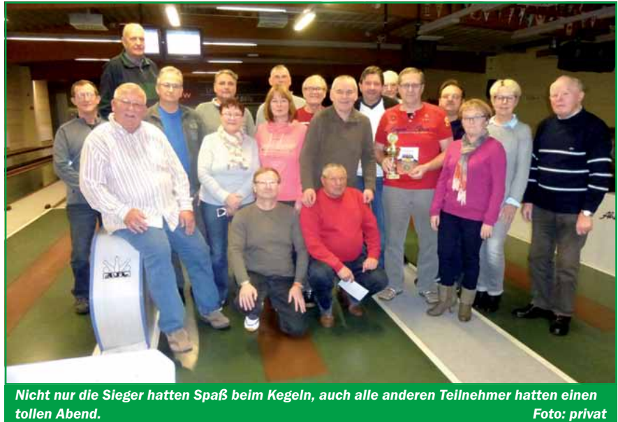
Nicht nur die Sieger hatten Spaß beim Kegeln, auch alle anderen Teilnehmer hatten einen tollen Abend.

Bereits zum dritten Mal in Folge konnte die Mannschaft des Saalekreises den Wanderpokal verteidigen. Die Mannschaft aus Halle wird sicher alles daransetzen, den Pokal