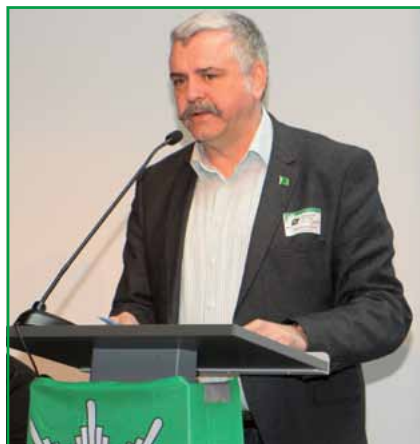
Der Landesvorsitzende auf dem außerordentlichen Landesdelegiertentag am 5. Mai 2017.