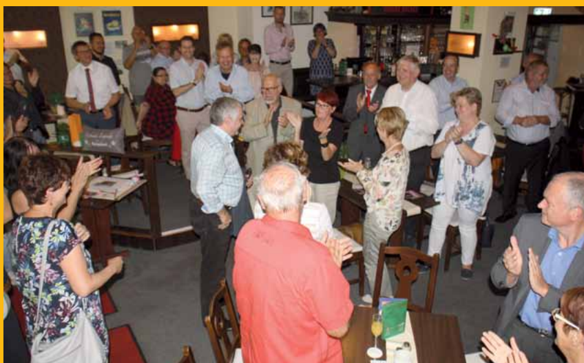
Auf ihn warteten schon viele Freunde und Weggefährten.