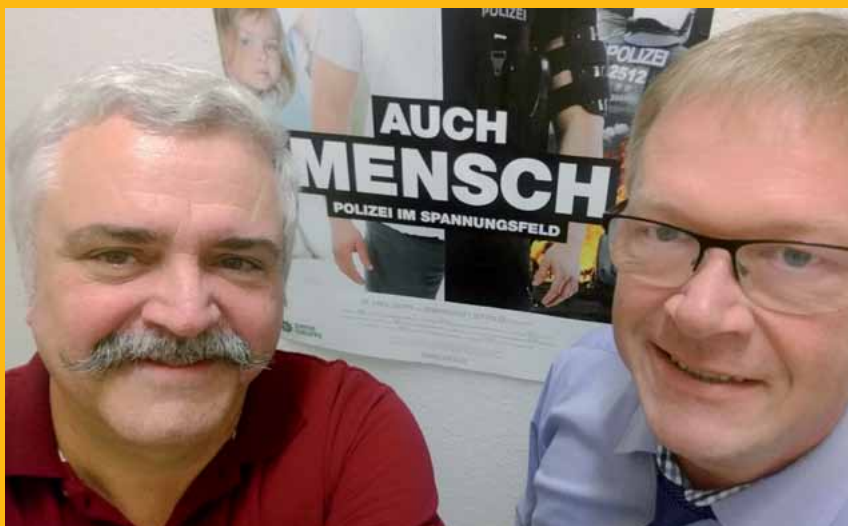
Uwes letzter Arbeitstag im MI.