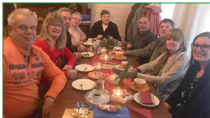
In einer gemütlichen Runde feierten die Senioren/-innen in die Weihnachtszeit.