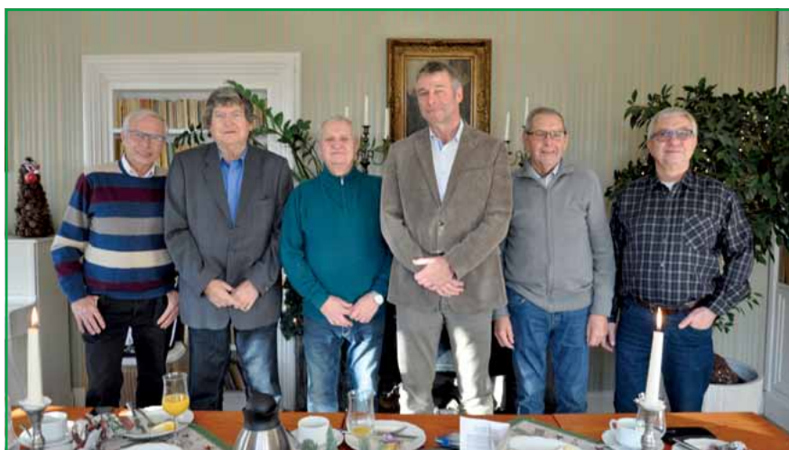
Senioren-Sicherheitsberater aus Magdeburg beim traditionellen Weihnachtsessen.