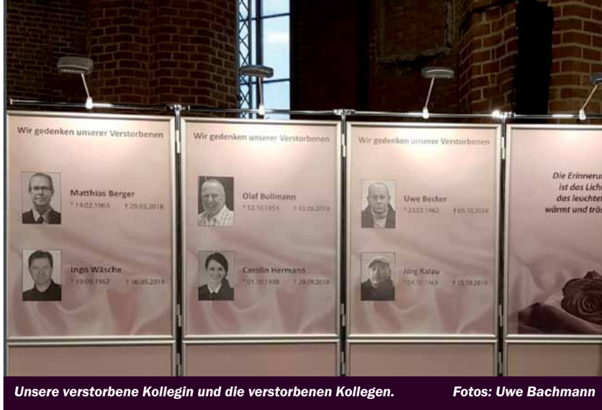
Unsere verstorbene Kollegin und die verstorbenen Kollegen.