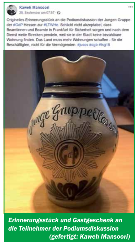
Erinnerungsstück und Gastgeschenk an die Teilnehmer der Podiumsdiskussion (gefertigt: Kaweh Mansoori)

Nach der Landtagswahl stellt sich vor allem die Frage, welche Versprechungen seitens der Politik angepackt und umgesetzt werden. Die JUNGE GRUPPE wird der neuen Landesregierung sowie den Fraktionen im Hessischen Landtag diesbezüglich genau auf die Finger schauen und diesen nötigenfalls in die Wunde legen.