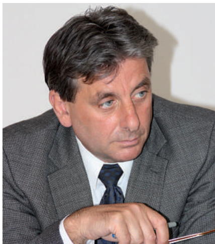
Landespolizeipräsident Udo Münch

Bälde die Anhebung kommt. Auch eine Anhebung in wenigen Schritten wäre akzeptierbar.