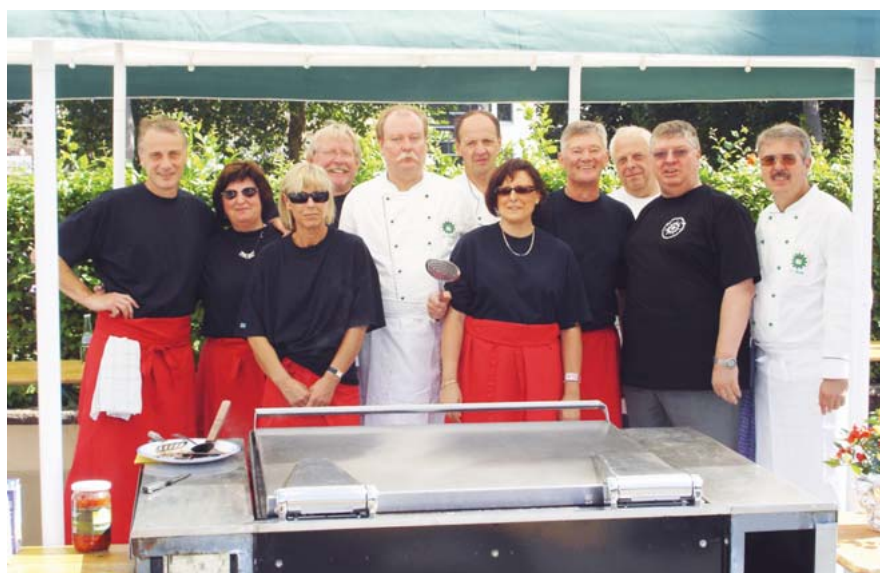
Die beiden Kochklubs aus Saarlouis sorgten für das leibliche Wohl der Gäste. Über 800 wohlschmeckende Essen wurden an die Frau/den Mann gebracht. Der Erlös fließt an die Polizeiseelsorge.