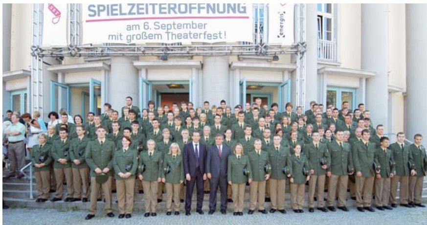
Die Neueinstellungen 2009 vor dem Staatstheater