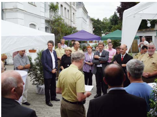
Die Gäste beim Hoffest der PI Alt-Saarbrücken