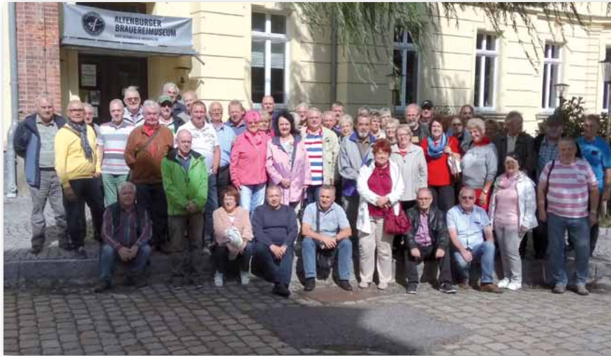
Gruppenfoto vor dem Brauereimuseum,

Ausgangspunkt der Besichtigung war das Brauereimuseum, dieses be-