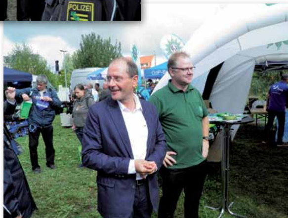
Innenminister Markus Ulbig und die Polizeiführung am Stand der Gewerkschaft der Polizei

Wir als Bezirksgruppe der GdP Görlitz hoffen, alles in unseren Kräften mögliche getan zu haben, um unseren Beitrag zum Gelingen des Tages der Sachsen in Löbau geleistet zu haben. Dies