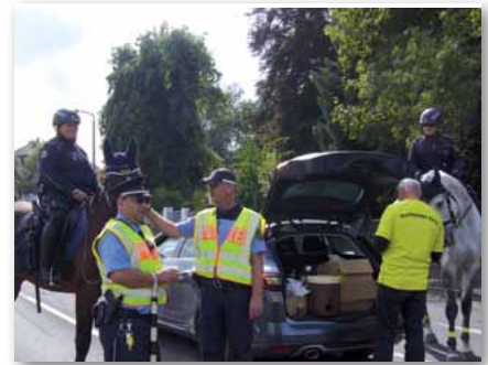
Auch an die Kollegen der Reiterstaffel und ihre treuen Tiere wurde gedacht!

verrichtenden Kollegen keine warme Mahlzeit angeboten, was bei den Kollegen der Bundespolizei kein Problem darstellte. Einige zugeordnete Kräfte waren weit im sorbischen Gebiet in einem Kloster untergebracht, was zwar erheblich lange An- und Abfahrtsweg zur Folge hatte, aber den Genuss einer warmen Mahlzeit garantierte. Die abgeordneten Kollegen, welche schon mehrfach die