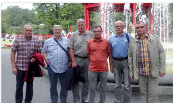
Die „jüngste“ Seniorengruppe!

zur freien Verfügung hatten und als „Männertruppe“ keine Lust auf Ge-schäftsbummel über den Ku'damm verspürten, blieb