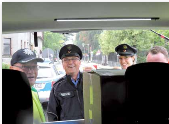
Versorgung vor Ort

Die Versorgung nach Dienst durch die gastgebende Dienststelle stand ebenso in der Kritik. Es wurde für die teilweise über zwölf Stunden Dienst