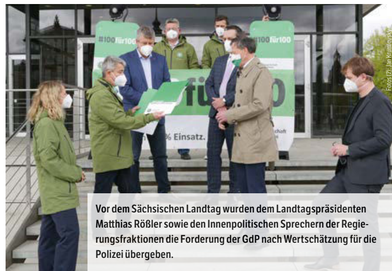
Vor dem Sächsischen Landtag wurden dem Landtagspräsidenten Matthias Röbner sowie den Innenpolitischen Sprechern der Regierungsfaktionen die Forderung der GdP nach Wertschätzung für die Polizei übergeben.