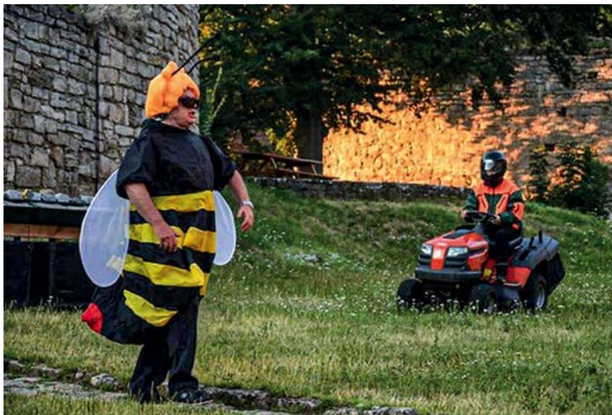
Die Hummel wird gleich überfahren