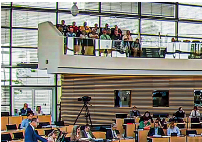
Jenaer Senioren auf der Tribüne ...