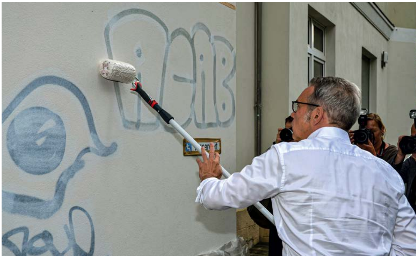
Innenminister übermalt ACAB-Schmiererei