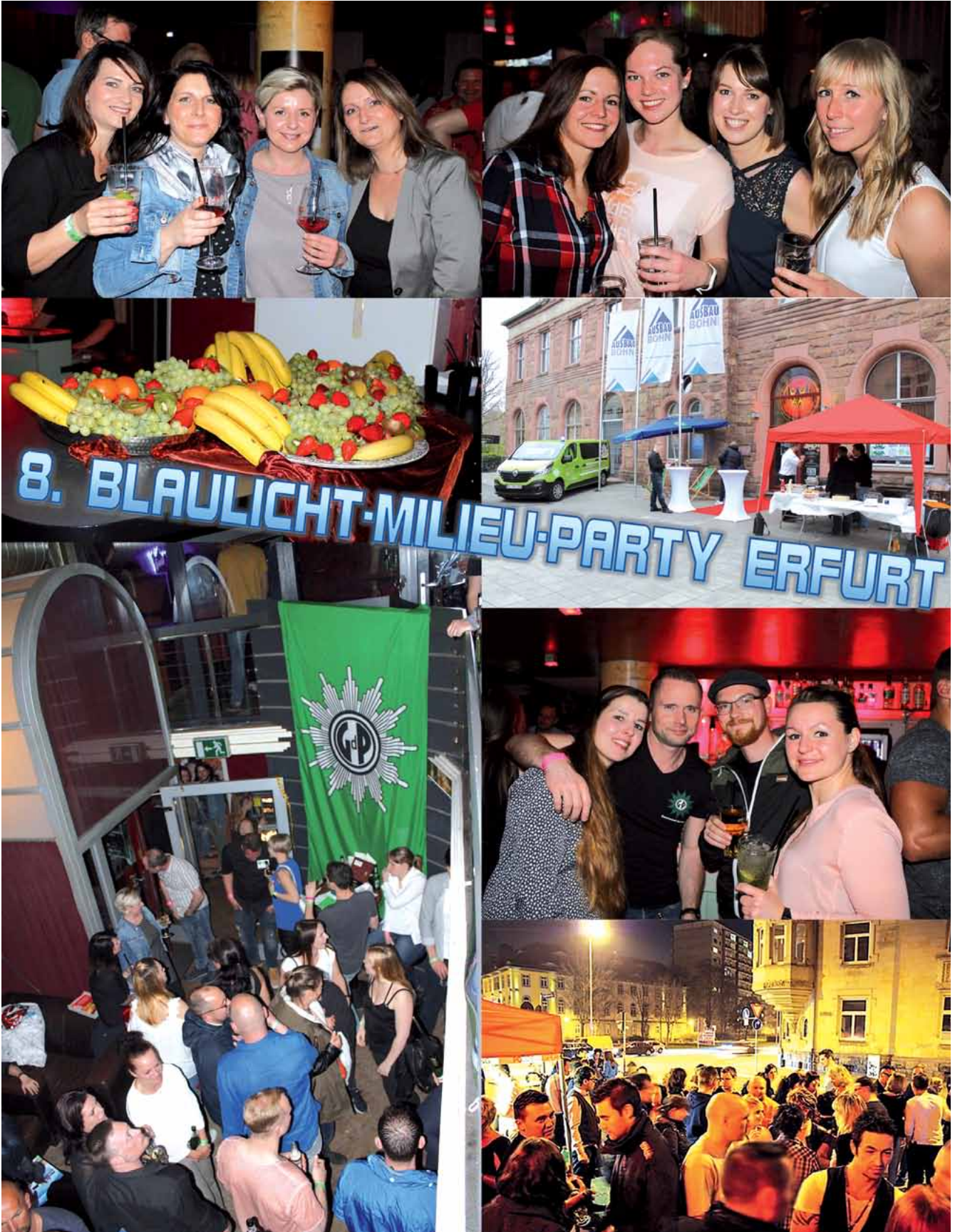
Impressionen von der Blaulichtmilieuparty 2017