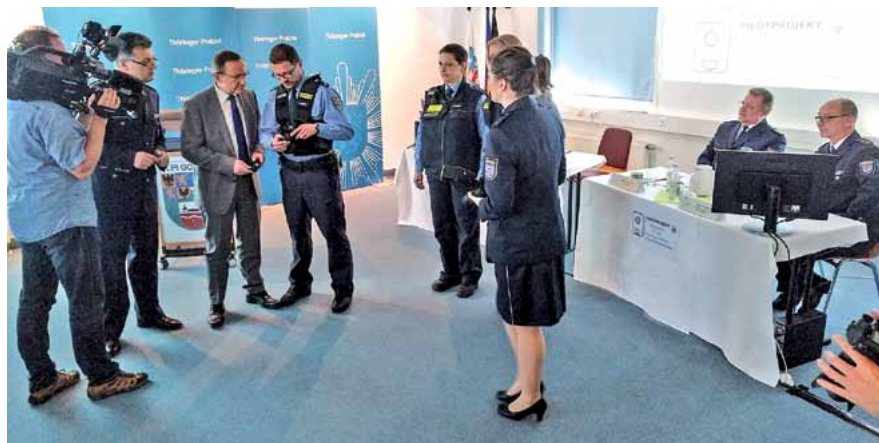
Der Innenminister (3. v. l.) lässt sich die Bodycam zeigen.

Es wird nicht dauerhaft gefilmt, sondern nur anlassbezogen in bestimmten Situationen, aus denen eine Gefahr für die eingesetzten Polizeibeamten hervorgeht. Es werden ausschließlich Bildaufnahmen, keine Tonaufnahmen gefertigt. Die Entscheidung zur Aufnahme trifft ausschließlich der Beamte, der die Kamera trägt. Schätzt er die Situation aufgrund seiner polizeilichen Erfahrung so ein, dass eine Gefahr für den Polizeibeamten besteht, kann aufgezeichnet werden.