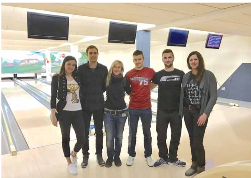
Auf der Bowlingbahn

Bei einer Runde Bowling, gemütlichem Beisammensein und anschließendem Abendessen wurde über die Probleme der vergangenen Jahre gesprochen und wie man in Zukunft die JUNGEN GRUPPE wieder zusammenführen könnte. Und da gib es auch schon erste Ideen. Für den Sommer 2017 wurde eine Veranstaltung vorgeplant, sodass sich die Mitglieder schon bald über ein schönes Event freuen können. Weitere Informationen folgen in Kürze.