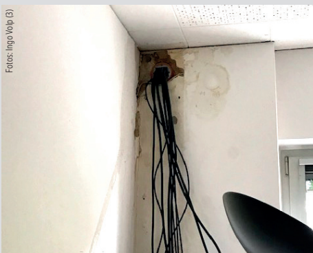
Im 1. OG hat sich das Wasser durch diesen Kabelschacht seinen Weg gesucht.

Die Sanitärbereiche werden aktuell wieder gereinigt, auch die sonstigen Bereiche wieder. Der Reinigungszustand lässt aber oft zu wünschen übrig. Die Sanitärbereiche, die Hebeanlage, der Wachtisch, das Einfahrtstor, der Gewahrsam; alle sind heruntergekommen und brauchen einen Austausch oder eine Renovierung, ein Fall von am falschen Ende gespart. ■