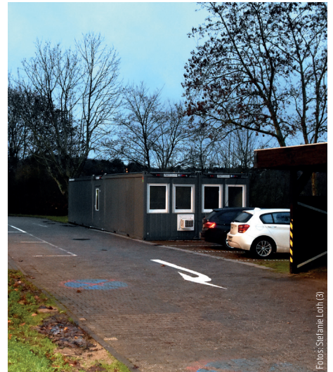
Die Wache befindet sich aktuell in diesen Containern.

Bei unseren GdP-vor-Ort-Terminen haben wir von weiteren baulichen Mängeln erfahren. Deshalb starten wir hier eine Reihe der Berichterstattung über die schlimmsten Zustände auf den Dienststellen. Stimmt euch mit euren Kreisgruppen ab, diese sollen uns Bilder und Beschreibungen der Zustände zuschicken und wir veröffentlichen hier jeden Monat die gruseligste Ecke.