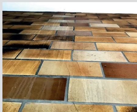
Im Treppenhaus sind die Kacheln an der Wand gerissen.