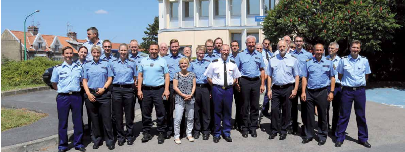
„Familienfoto“ mit den Kolleginnen und Kollegen der Gendarmerie in Amiens