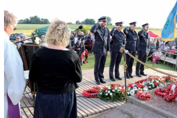
Kranzniederlegung am Lochnagar

Mit einem lauten Knall ging die einzigartige Gedenkfeier los. Ein Dudelsackspieler spielte Klänge des damaligen Schlachtfeldes. Rund um den Krater versammelten sich Menschen aus unterschiedlichsten Ländern, um gemeinsam der gefallenen Soldaten zu gedenken. Nach diversen Kranzniederlegungen und einem