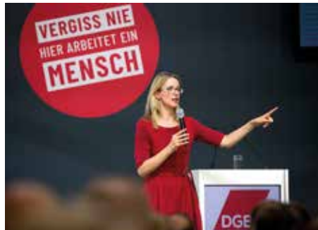
Prof. Dr. Alena Buyx gab einen Impuls zum Thema Verrohung der Gesellschaft.

Interessant hierbei war, dass es schon Städte wie Aachen und Köln gibt, welche hier mit Modellen (Aachener Modell) einen Weg gehen, um gerade Menschen gegen Ge-