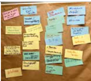
Die wichtigsten Themen im Überblick

„ Zitat des ehemaligen Landrates aus dem Kreis Altenkirchen Dr. A. Beth auf Facebook Eine vorbildliche Seniorenarbeit. Andere Organisationen, wie zum Beispiel die politischen Parteien, könnten sich bei Ihrer Seniorenarbeit eine Scheibe davon abscheiden.“