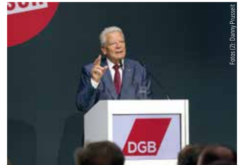
Der Bundespräsident a. D. Joachim Gauck redete zum gesellschaftlichen Zusammenhalt.