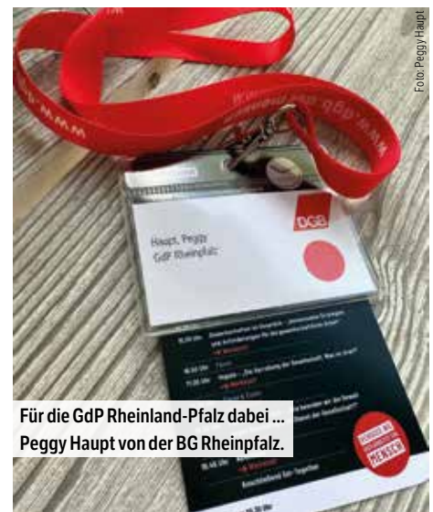
Für die GdP Rheinland-Pfalz dabei ... Peggy Haupt von der BG Rheinpfalz.