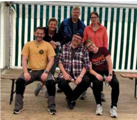
Eine ziemlich müde Helfertuppe