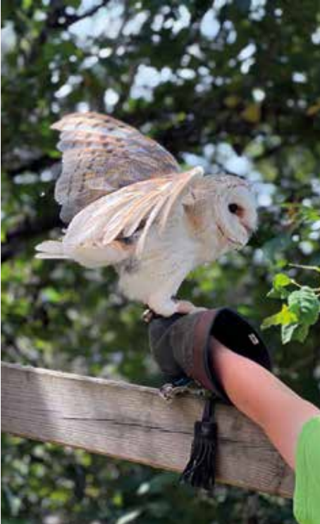
Über viele Tiere gab es einiges zu lernen für die Kinder.