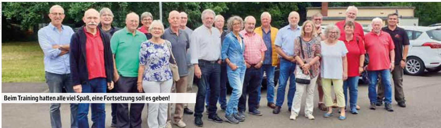
Beim Training hatten alle viel Spaß, eine Fortsetzung soll es geben!