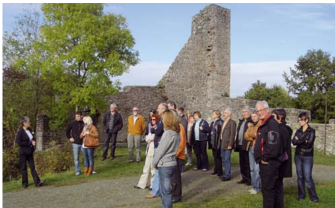
Die Kreisgruppenmitglieder nebst Anhang bei der Burgführung.

Im Oktober führte die Kreisgruppe St. Wendel ihre traditionelle Herbstaktion durch. Auf Burg Lichtenberg in der benachbarten Pfalz trafen wir uns bei herrlichem Wetter, um uns die größte Burgruine Deutschlands bei einer Burgführung