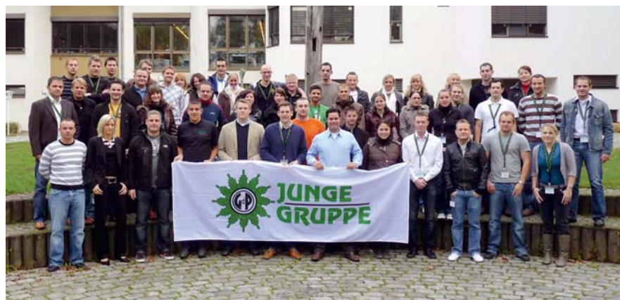
Die Delegierten der JUNGEN GRUPPE aus Rheinland-Pfalz und dem Saarland.

Ein wesentlicher Tagesordnungspunkt der Konferenz war natürlich auch die Wahl des neuen Landesjugendvorstandes. Nachdem zuvor der Geschäftsbericht des „alten“ Landesjugendvorstandes