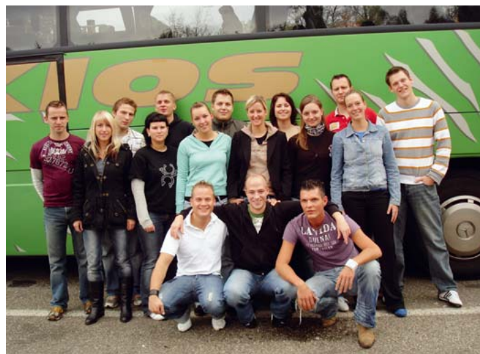
Die JUNGE GRUPPE auf Bildungsfahrt