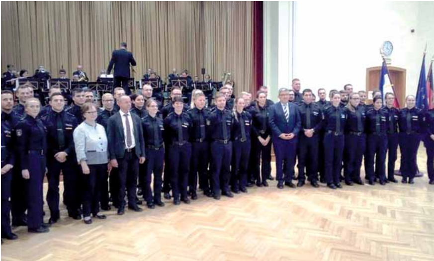
Gruppenfoto mit Innenminister Lorenz Caffier und WIR wünschen EUCH viel ERFOLG!

Herzlichen Glückwunsch allen Kolleginnen und Kollegen des Einstellungsjahrganges 2014 zur Bachelor-Verleihung und zur Ernennung zum Polizeikommissar und zur Polizeikommissarin.