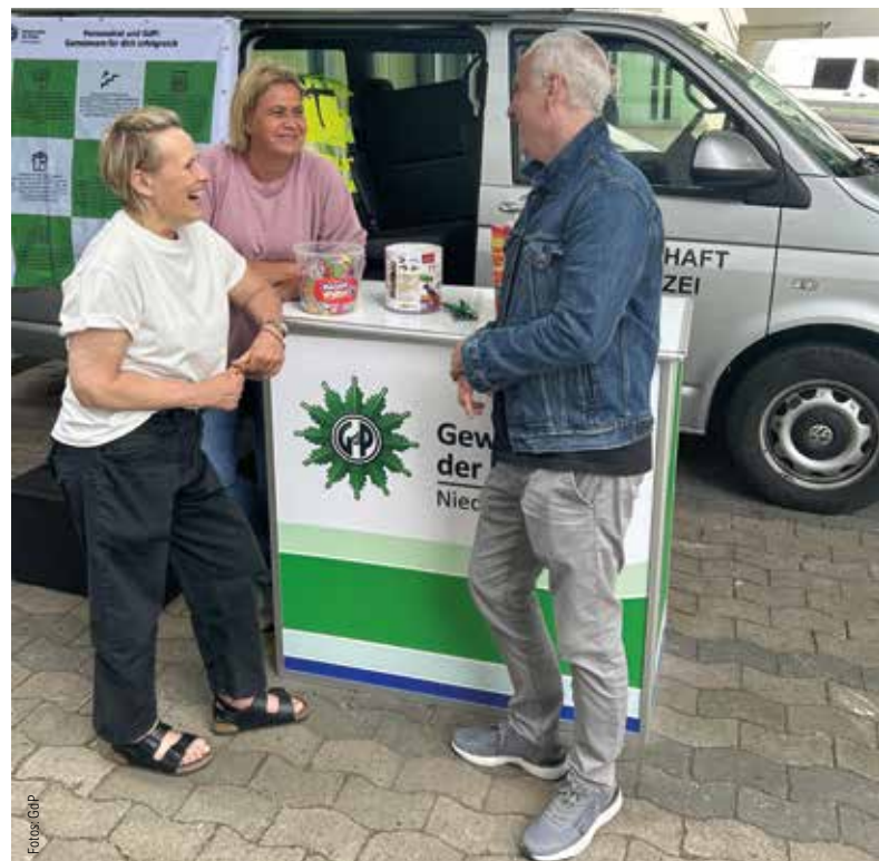
... wie hier während der Dienststellenbereisung in der PD Hannover im Juli.