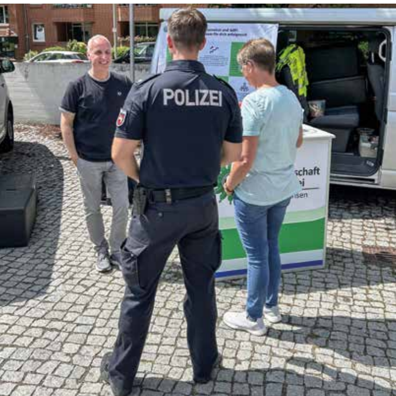
Personalräte haben immer ein offenes Ohr für die Anliegen der Polizeibeschäftigten ...

Auf den einzelnen Ebenen haben die Personalräte nämlich wichtige Befugnisse: Sie besitzen an vielen Stellen ein Mitspracherecht,