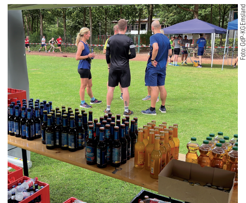
Die GdP erfrischte die Sportler:innen am Zieleinlauf mit leckeren isotonischen Getränken.