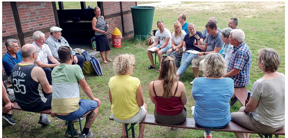
Die Kreisgruppe Stade beging ihre JHV zusammen mit einem Sommerfest als gemütliche Veranstaltung am Badesee Fredenbeck.